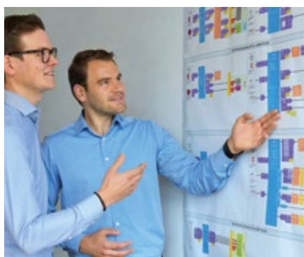
Konstruktiver Meinungs-austausch für optimale Prozessabläufe